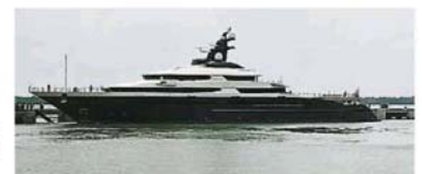
平静号抵达巴生港口时，全国媒体几乎都同步进行直播，让全民一睹豪华游艇真正的面貌！

这一艘豪华游艇，应该是我从业以来，见过最豪华的游艇，而且据了解，游艇内奢侈品应有尽有，每个月的保养费高达上百万令吉，真令人咋舌，果然贫穷限制了我的幻想。