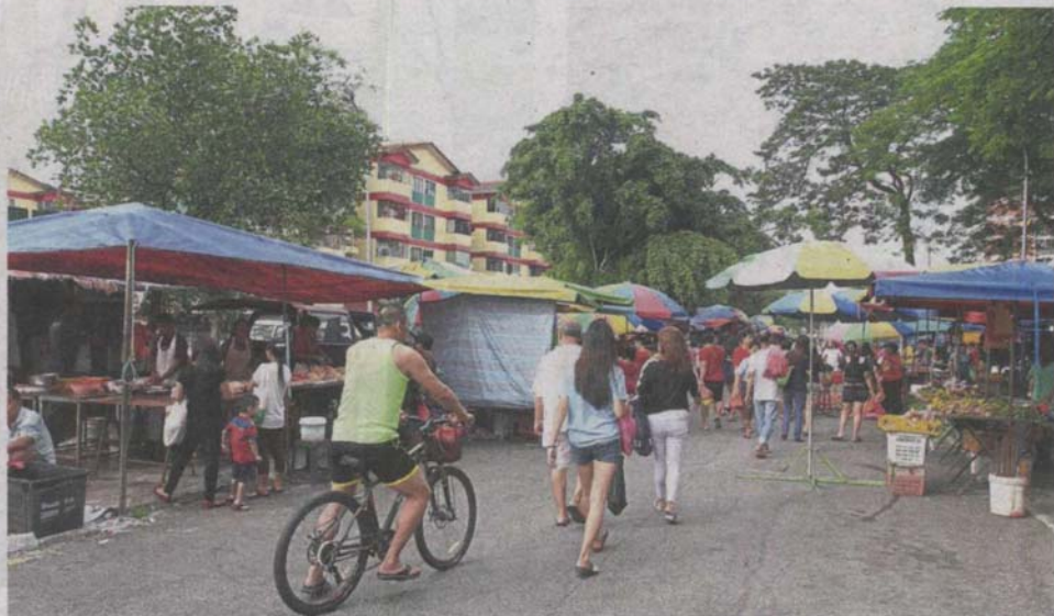
The Bandar Sungai Long morning market in Persiaran SL1, Bandar Sungai Long. MPKJ plans to move the market to an empty plot of land (below) just beside Taman Taming Indah.

On the traders' side, Lee said only three association members