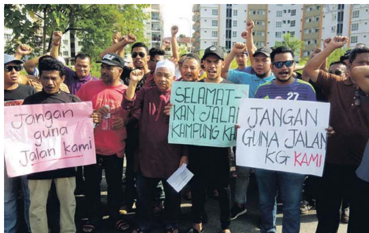
Penduduk kampung Penduduk Kampung Pasir bantah kerja pemasangan paip.

"Kami mendesak MPAJ membuka laluan 'ramp' berhampiran kondominium tersebut. Penduduk kampung berharap Kementerian Perumahan dan Kerajaan Tempatan dan Kerajaan Negeri Selangor dapat membantu menyelesaikan