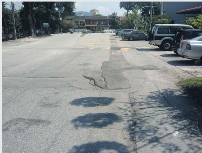
Jalan menjadi rosak selepas kerja mengorek jalan dilaksanakan.