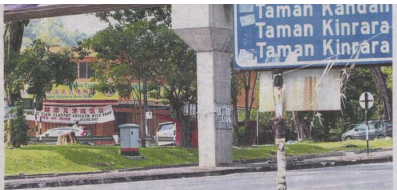
One of the coffeshop owners had already agreed to move and is currently renovating a place located just opposite the road as seen in this picture.