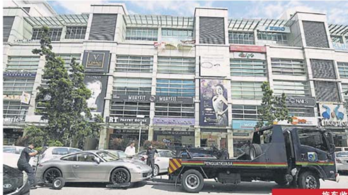
双重停放车辆的车主只能眼睁睁地看着自己的车子，被执法单位强行拖走。

他说，辖内大部分商业区都有按发展规划，提供多层停车场或露天停车场，也有私人停车场；有足够停车位。“只是大多数人为了己便，不