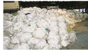
堆积在瓜冷非法塑料工厂内的洋垃圾。