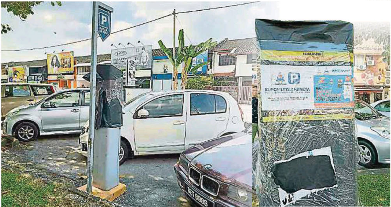
八打灵再也市政厅管辖区内有多达700架电子泊车售票机，仍未被移除。