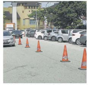
市议会使用三角锥筒阻挡道路，让市民无法双重停放车辆。

她说，商业区有足够停车位，但车主为了方便而随意泊车，大部分甚至不见人影，阻挡了合法停放车主的出入，令他们感到不满。