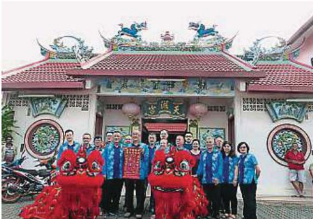
右天湖宫理事在庙前合照。